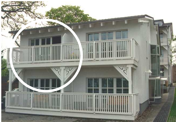
Wohnung Nr.: 14