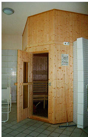
Blick in die geöffnete Sauna

Das Schwimmbad (mit Gegenstromanlage) lädt Sie täglich wieder ein, sich bei angenehmen warmen Temperaturen zu erfrischen.