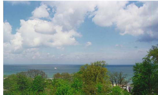
Blick vom Balkon auf die Ostsee

Verbringen Sie Ihre „schönsten Wochen im Jahr“ auf Rügen, Deutschlands größter Insel, in einer komfortablen, 1995 erstellten Ferienwohnung im Zentrum des Ostseebades Göhren mit einem herrlichen Seeblick und Hanglage zum Strand (Entfernung ca. 300 m).