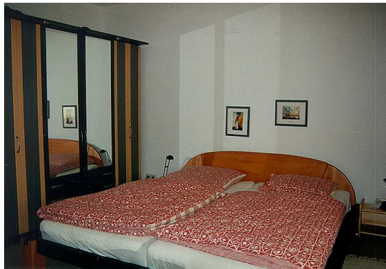
Blick ins Schlafzimmer