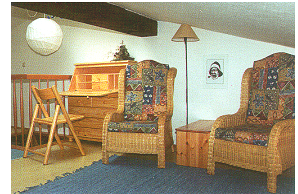
Die Lese- und Schreibecke auf der Galerie

Die Galerie bietet Ihnen neben zwei Betten eine Lese- und Schreibecke, in die Sie sich zurückziehen können, wenn Sie ungestört einmal ein Buch lesen oder einen Brief schreiben wollen.