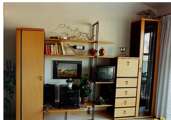
Schrankwand mit Stereoanlage und Farbfernseher

In der 1. Etage befinden sich die Küche, die Essecke und der Wohnbereich mit dem Blick direkt zur Ostsee und darüber die Galerie mit 2 weiteren Betten .