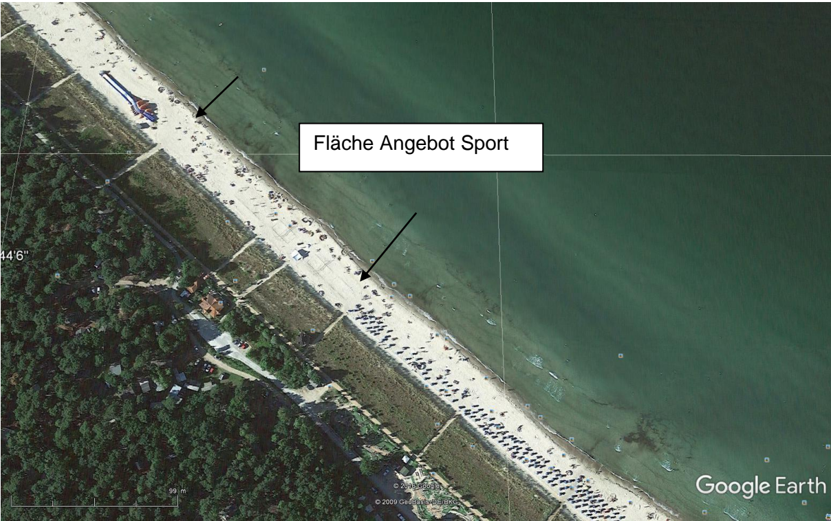
Bereich des Sportstrandes